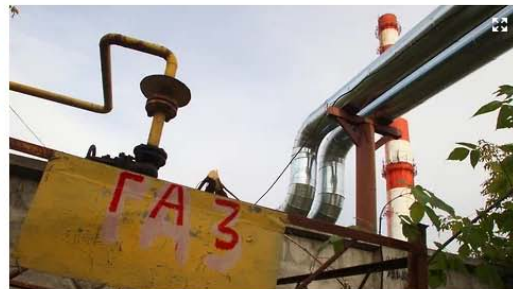
По данным краевой администрации, в регионе начали работать 160 из 236 котельных

Власти Новороссийска готовят иски к поставщику теплоэнергии из-за отсутствия отопления в домах и соцобъектах